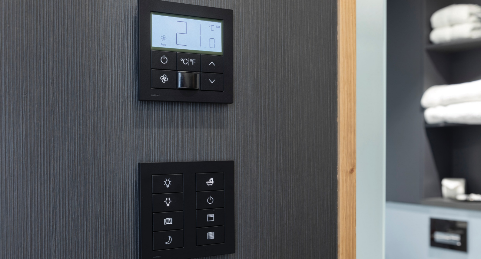
美しく便利なPalladiom（パラディウム）のサーモスタットとキーパッド