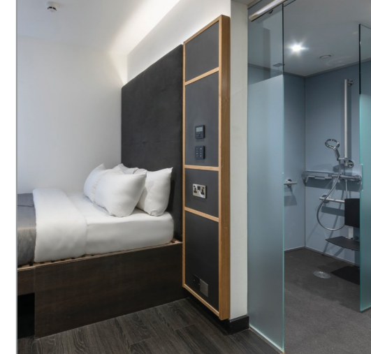
myRoomソリューションはゲストが直感的に操作でき、ホテルの他のシステムともシームレスに連携しています。

さらに、人感センサーでエネルギー節約、コスト削減にもつながるとKing氏は付け加えます。